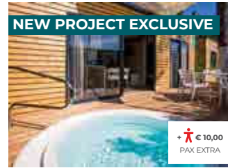
NEW PROJECT EXCLUSIVE