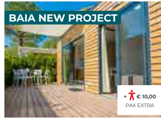
BAIA NEW PROJECT